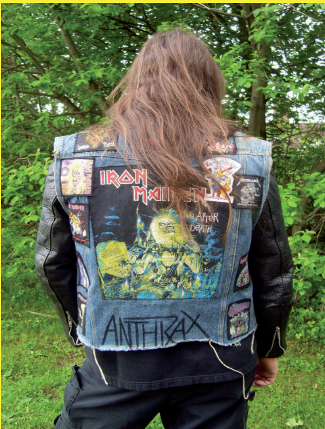
„Metal Matters“ – Heavy Metal als Kultur und Welt

3. bis 5. Juni 2010 Aula der HBK Braunschweig